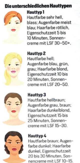
3. kép. „A különböző bőrtípusok”