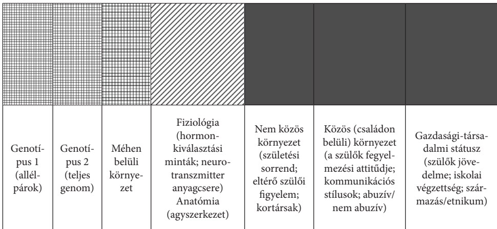
5. ábra. A fiziológiai és anatómiai kutatás potenciális oksági tere. Az átlók aktív teret jelölnek, a rácsok az aktív tér lehetséges determinánsait jelölik, a sötét cellák inaktív terek, bár néhány kutatás kontrollált változóként bevonja a családon belüli és a különböző családok esetében közös környezetet