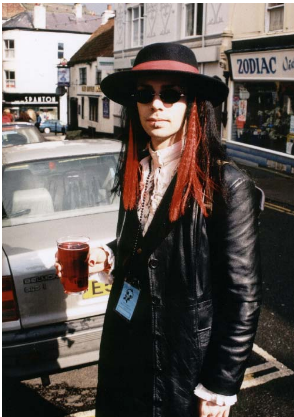
2. ábra. Vámpíros motívumokból is merítő összeállítást viselő goth férfi.