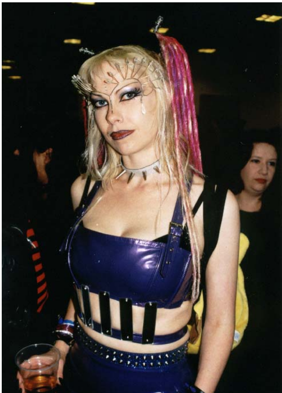
4. ábra. Az eredeti punk gyökerekhez is visszanyúlik a fetishruhák és -hatások '90-es évek során a goth színtéren belül mindkét nem körében tapasztalt térhódítása. A képen ilyen stílusjegyeket mutató ruhát viselő goth nő látható.