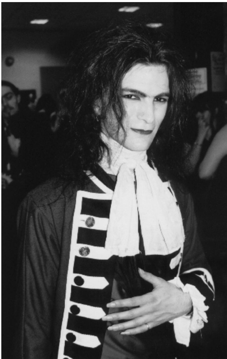
5. ábra. Olyan új romantikus együttesek, mint az Adam and the Ants hatását mutató, történelmi divatstílusokat megidéző goth férfi.