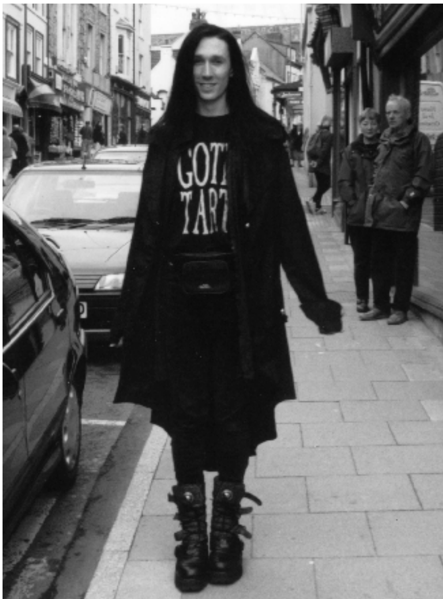
1. ábra. Önirónikus felirattal (goth tramp) ellátott pólót viselő goth férfi. (Fotó: S. L. Hodkinson)

A fényképek a Goth: Identity, Style and Subculture című könyvben (Paul Hodkinson 2002, Oxford: Berg) jelentek meg. A képfeliratok a könyv vonatkozó részei alapján készültek. Minden kép © S. L. Hodkinson. A képek a szerző és a képek készítőjének szíves hozzájárulásával jelennek meg.