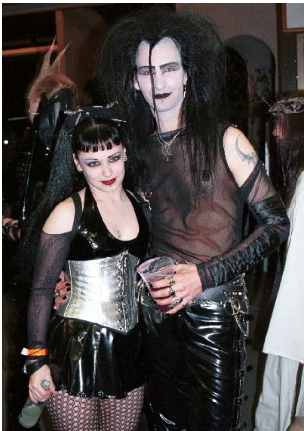
6. ábra. A '80-as évek eleje óta töretlenül divatos stílus elemeket felvonultató goth pár.