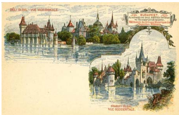
2. kép. A millennium alkalmából kiadott képes levelezőlap

ros tapasztalata a valós város tüköralakzataként igazítja a tekintetet a látványhoz. A modern nagyvárossá válás olyan mozzanatai, mint az urbánus tér differenciálódása, a térhasználati szokások kialakulása, nem csak tematikusan jelennek meg a képeslapokon, hanem maguk a képeslapok is hozzájárulnak e nagyvárosjelenségek kialakulásához. Elsősorban nem dokumentálják az urbanizációt, hanem működtetik annak folyamatait, ők maguk is a nagyvárosi események zajlásának helyei. Megteremtik a levélnél olcsóbb társadalmi érintkezés lehetőségét, a modernség mobilitásélményének közvetítői és kihasználói; boríték nélküli postai kézbesítésük újraírja a privát és a közszféra határait, sokszorosíthatóságuk és szerialitásuk a századforduló népszerű médiumaivá teszi őket.